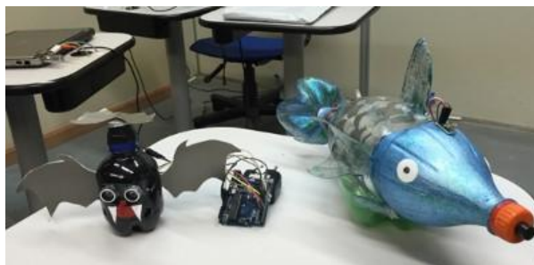
Figura 3. O morcego-robô e o peixe-robô

morcego-robô, possuem partes que são entregues já montadas pelo professor e outras que são construídas e montadas pelos alunos.