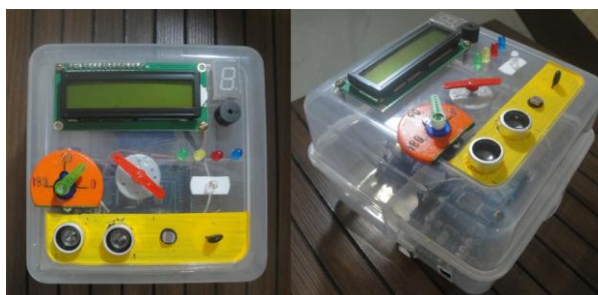
Figura 2. A "caixinha mágica" contendo os seguintes componentes: 1 display LCD, um display de 7 segmentos, 1 buzzer, 1 servo motor, 1 motor DC, 4 LEDs, 1 LED RGB, 1 sensor de distância, 1 sensor de luz e 1 sensor de temperatura.

Um desses materiais é uma caixinha batizada de "caixinha mágica" (Figura 2) que permite às crianças programarem simultaneamente um conjunto de atuadores e sensores.